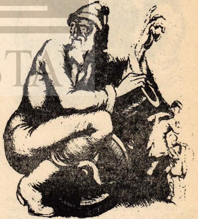
Noel baba bunadı

Bu üç şiirden «Ben Goya'yım» başlıklı şairin en çok sevdiği ve her şiir matinesinde okumadan edemediği şiirlerden biri imiş. Bu şiirin Rusça aslındaki asonansları Türkçe çevirisinde az - çok verebilmek için «düşman» yerine «yağı», «Batı» yerine Garp» dedik. «Kaygı, yankı, gırtlak, kabara» gibi sözleri de, özellikle, bunun için seçtik.