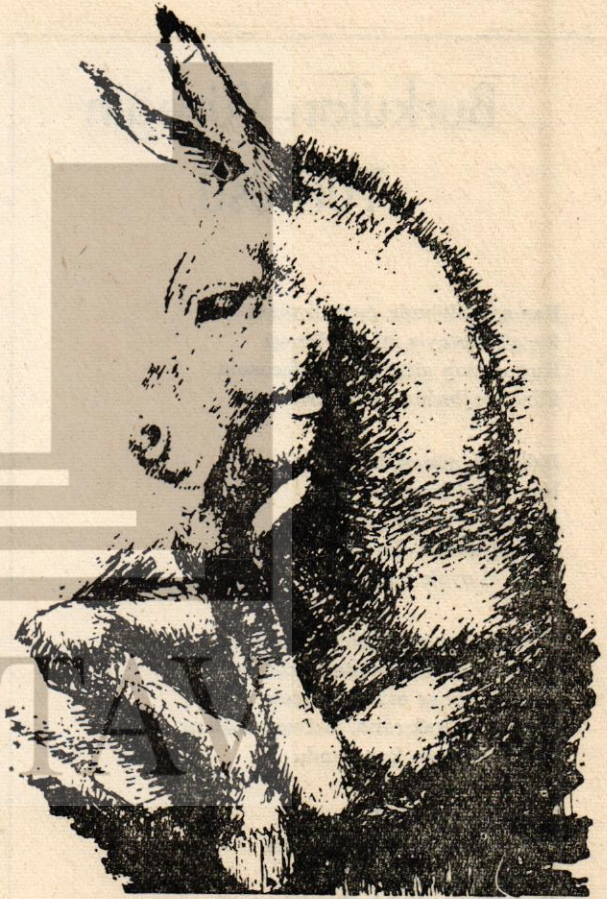
Eşekler de düşünür

Bu tür eleştiriler sürdürülürken, 1939'da Halk Partisi'nin ressamlar için düzenlediği yurt gezileri başlar; Güzel Sanatlar Genel Müdürlüğüne getirilen Suut Kemal Yetkin'in çabasıyla, plastik sanatlar alanında devlet sanat politikasını yansıtmak amacıyla önemli bir dergi, Güzel Sanatlar Dergisi ve ayrıca Milli Eğitim Bakanlığınca bir sanat ansiklopedisi yayınlanmaya başlanır (10). Genellikle eski Türk sanatı ve mimarisi, heykel, grafik, müzik ve fotoğrafla ilgili yazıların dışında