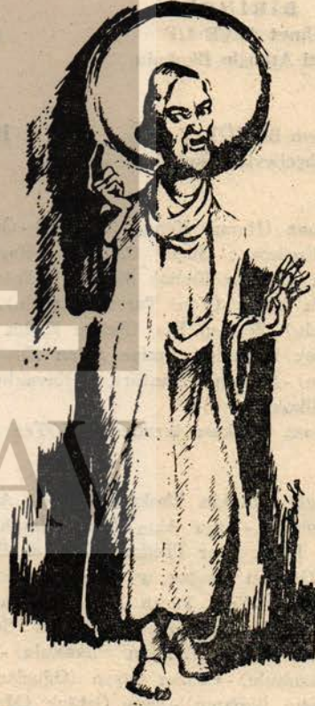
Ey İnsanlar birbirinizi seviniz