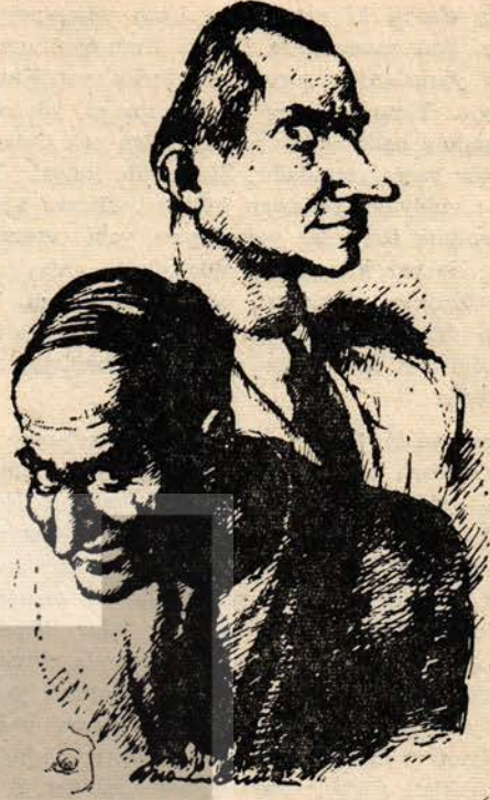
Salla başla dik baş

Ahmet Mithat'ta ise öykü ve roman gibi Batılı türlere meddah anlatımının sokulduğu görülür. Ne var ki, Şinasi'deki başarısızlığın daha da koyusuyla karşılaşırız bu uygulamada. Batı, destan, halk öyküsü ve bunların evrimiyle oluşan öteki türleri süreç içinde dönüştürerek romana ulaşmıştır. Yani roman ve klasik anlamda öykü, burjuvazinin iktidar öncesi oluşturduğu kültürünün ürünleridir. Dönüşümle ortaya çıkmıştır. Ahmet Mithat ve benzerleri ise bu kültürel verilerden yararlanarak Batılı romanı özgün bir yapıya kavuşturmak için çaba gösterecekleri yerde, meddah geleneğinin kimi öğelerini yapıtlarına başarısızca «monte etmekle» yetinmişlerdir. Bu montajda halk kültürünün ciddi ve derinlemesine bir kavrayışla ele alındığına tanık olamıyoruz. Demek ki